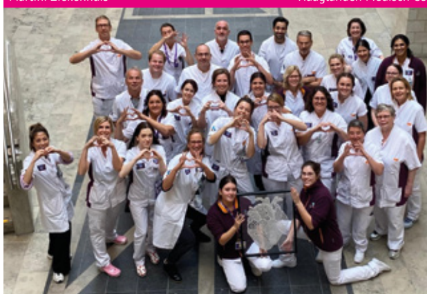
Albert Schweitzer Ziekenhuis