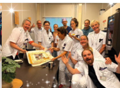
Haga Ziekenhuis Zoetermeer