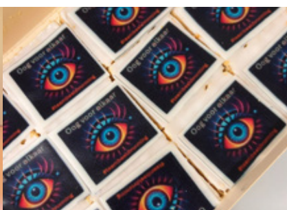
Haaglanden Medisch Centrum