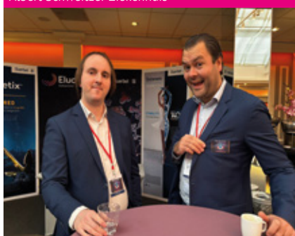
SWC Reehorst Ede