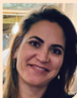
Fleur Bangert van Alrijne Ziekenhuis met locaties in Leiden, Leiderdorp en Alphen aan den Rijn naar St. Antonius Ziekenhuis in Nieuwegein per 1 oktober 2023