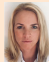
Hester Scheffer Van Sint Antonius Ziekenhuis Nieuwegein naar NWZ in Alkmaar/Den Helder per 1 mei 2023