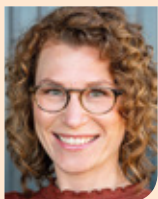
Emilie Weimar van Haaglanden Medisch Centrum in Den Haag naar Reinier de Graaf Gasthuis in Delft per 1 oktober 2022