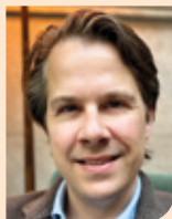
Lodewijk Roosen van Laurentius Ziekenhuis in Roermond naar Jeroen Bosch Ziekenhuis in Den Bosch per 1 april 2023