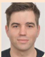
Viktor Versteegh van OLVG Amsterdam naar RKZ Beverwijk per 1 januari 2023